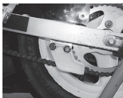
リアsproケットガード

2024年Daijiro-Cup規則に準じます。詳しくは74daijiro.netホームページを参照してください。 http://www.74daijiro.net/daijiro-cup/