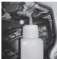
燃料キャッチタンク